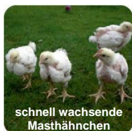
schnell wachsende Masthähnchen